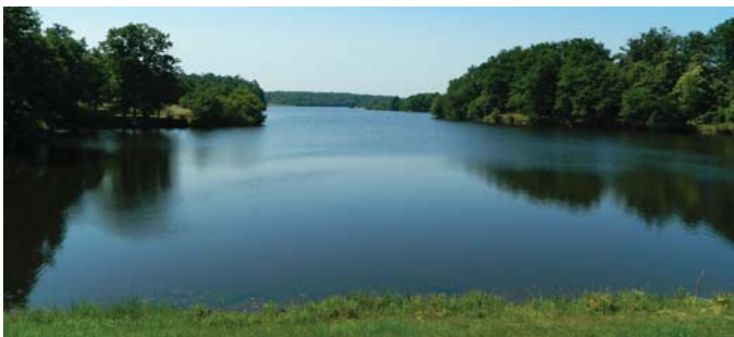
étang de la Pouge

7 A la route, prendre à droite puis de suite à gauche et remonter vers le bourg entre les maisons du faubourg et les murs des jardins en terrasse jusqu'à une fourche de deux rues. Tourner à gauche, rue Porte des Remparts et passer devant la Maison de Pais. Au carrefour, tourner à gauche et rejoindre la place de l'église.